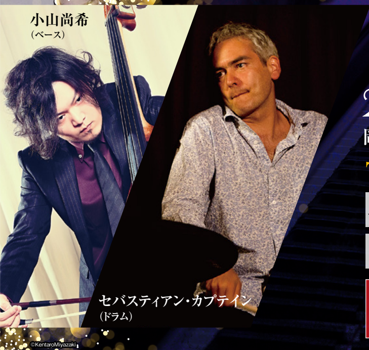
セバスティアン・カプティン (ドラム)