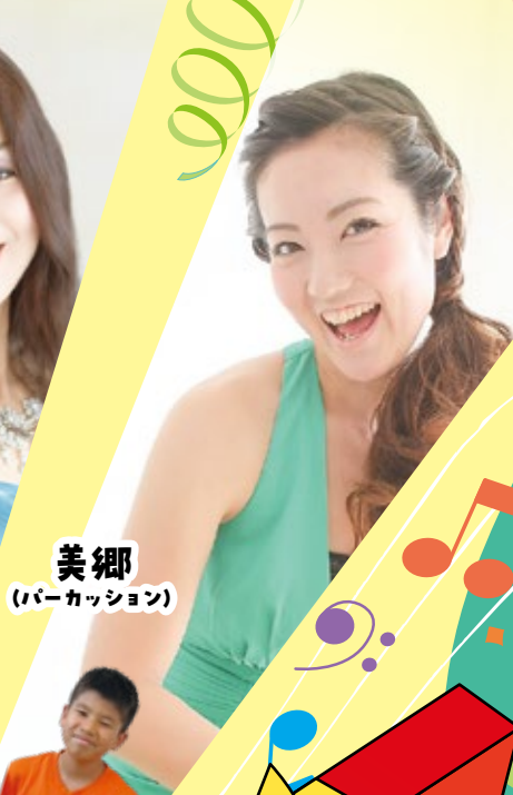
美郷 (バークッション)