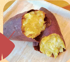
RinRin 庵 蜜焼き シルクスイート