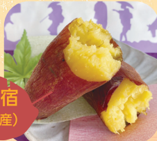
道の駅藤川宿 紅はるか(岡崎農家産)