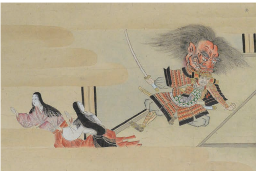
<大江山絵巻 下巻> 湯本豪一記念日本妖怪博物館（三次ものけミュージアム）蔵