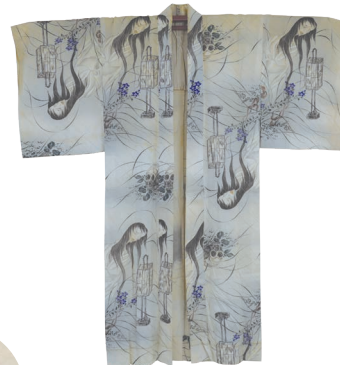
<幽霊図着物> 湯本豪一記念日本妖怪博物館（三次ものけミュージアム）蔵