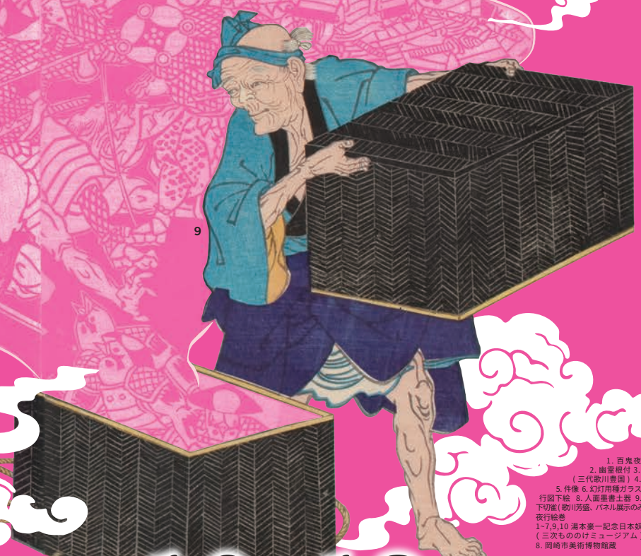
1. 百鬼夜行図下絵 2. 幽霊根付 3. 古猫の怪 (三代歌川豊国) 4. 鬼面團丸 5. 件像 6. 幻灯用種ガラス 7. 百鬼夜行図下絵 8. 人面熊土器 9. 菅ばなし下切絵 (歌川芳盛、パネル展示のみ) 10. 百鬼夜行絵巻 1~7,9,10 湯本豪一記念日本妖怪博物館 (三次ものけミュージアム) 蔵 8. 岡崎市美術館蔵