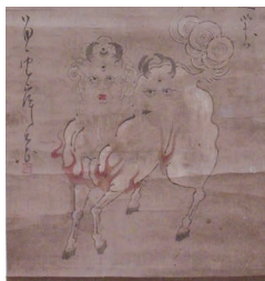
<白澤図> 湯本豪一記念日本妖怪博物館（三次ものけミュージアム）蔵