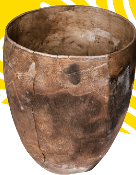
土器箱：岡崎市教育委員会所蔵