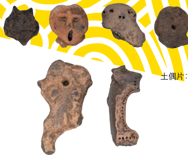
土偶片：岡崎市教育委員会所蔵