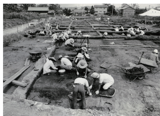
真宮遺跡2次調査風景

真宮遺跡が国指定史跡となって今年で50年になります。それを記念して、本展ではこれまでに行われた同遺跡の発掘調査の成果を、出土品とともに紹介します。