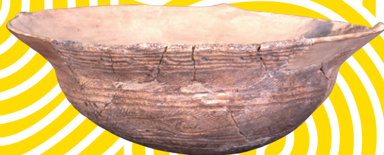
浅鉢：岡崎市教育委員会所蔵