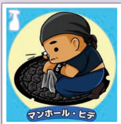
ひで@ボケふたメンテナンス部