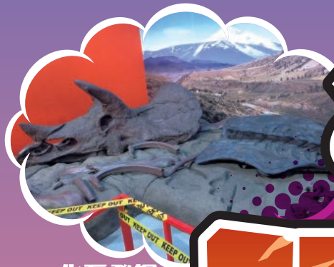
化石発掘 ジオラマ