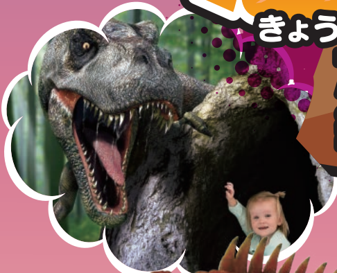
フотスポット トリック3Dアート