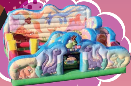
ティラノサウルスが 入口でお出迎え