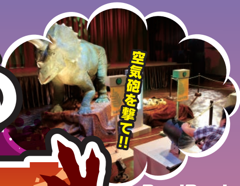
Boo! Boo! トリケラトプス