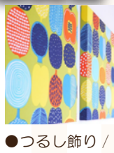
北欧グッズ・キッチン雑貨 北欧雑貨の店エテラ