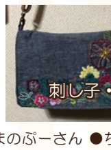
刺し子・刺繍などのワークショップ kids mothers 洋裁教室