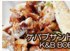
ケバブサンド K&B BOB