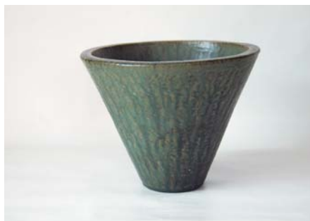
野村 正文 / 陶芸・石原町