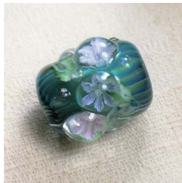
高山 秀美 / トンボ玉・宮崎町