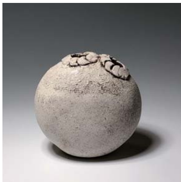
杉本 たけ子 / 陶芸・鹿勝川町