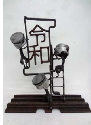
平松 聡志 / リサイクルアート・石原町