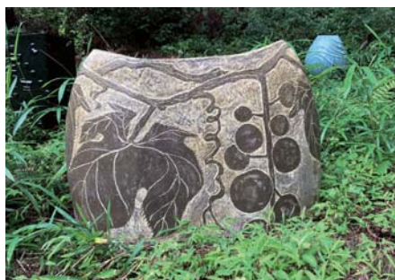
加藤 明人 / 陶芸・千万町町