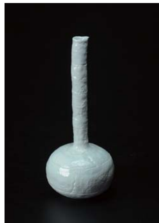
伊藤 勝彦 / 陶芸・木下町