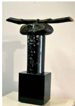
国島 征二 / 彫刻・絵画・木下町