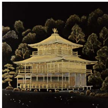
杉浦 傑 / 蒔絵・東河原町