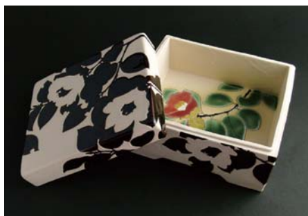
前田 正剛 / 陶芸・宮崎町