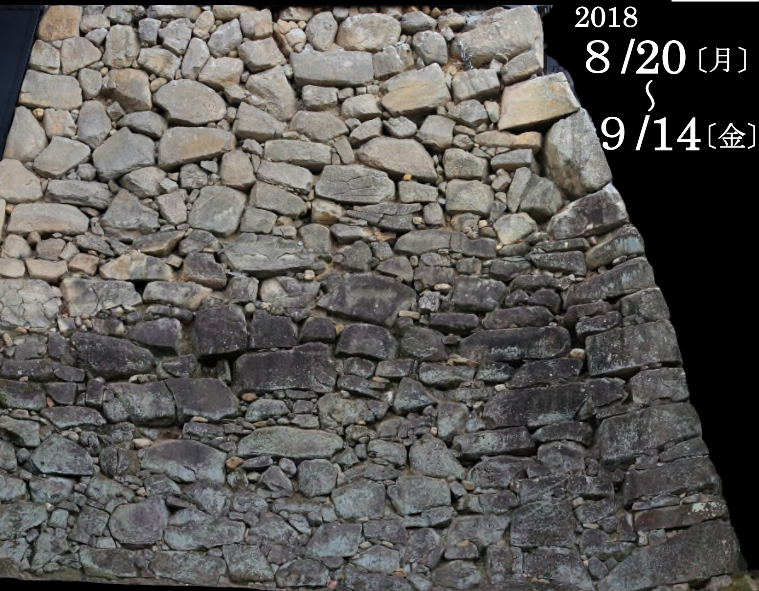
天守台石垣（南面）：城内で最も古い段階の石垣