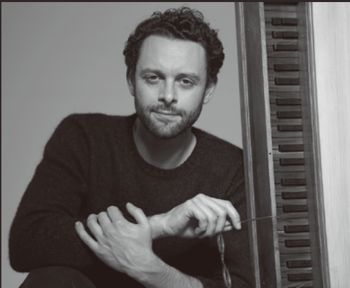
バンジャマン・アラール (チェンバロ) Benjamin Alard, Harpsichord

退団し、01年6月までジュネーヴ音楽院フルート科の教授として後進の指導にあたる。02年4月ベルリン・フィルに復帰、同オーケストラ首席奏者およびソロ・フルーティストとしての演奏活動を再開。世界の名だたるオーケストラおよびコンサートホールに招かれ演奏しており、日本ではリサイタルの他、NHK交響楽団、読売日本交響楽団、大阪フィルハーモニー交響楽団を含むオーケストラとの共演、室内楽公演、またマスタークラスも行っている。録音ではワーナー・クラシックスと専属契約を結び、20作を超えるCDをリリース。09年フランス芸術文化勲章「シュヴァリエ」受章。英国王立音楽院名誉会員。