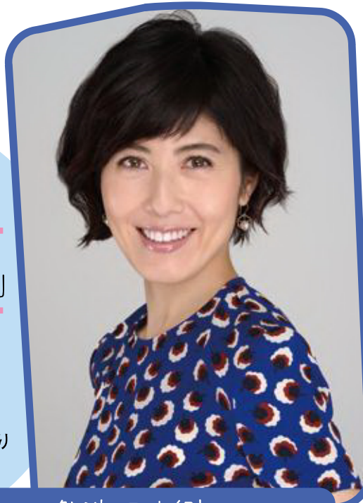
タレント・エッセイスト 小島 慶子 (こじま けいこ)

1975年東京都生まれ。社会学・男性学・キャリア教育論を主な研究分野とする。「日本では“男”であることと“働く”ということの結びつきがあまりにも強すぎる」と警鐘を鳴らしている男性学の第一人者。