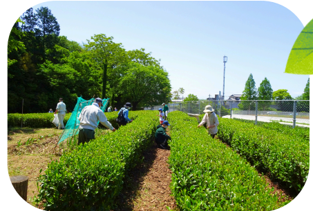
↑体験の森の茶畑です