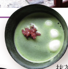
抹茶白玉 ぜんざい