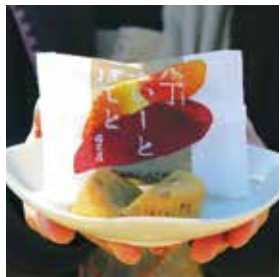
八丁すいーとぼてと 160円(税別)