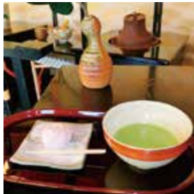
飲み比べセット 750円(税込)