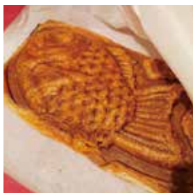
クロワッサンたい焼き 220円(税込)