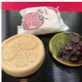
三ツ葵もなか 150円(税込)