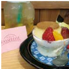
プリンアラモード 460円(税別)