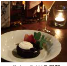
フォンダンショコラ 600円(税別)