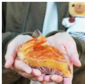
アップルパイ 350円(税別)