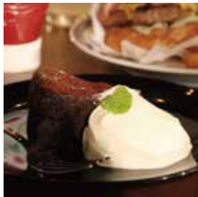
ガトーショコラ 480円(税込)