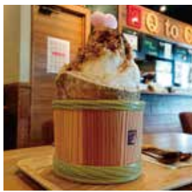
みそ桶こおり 1,100円(税込)