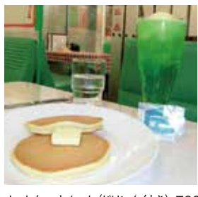
ホットケーキセット(ドリンク付き) 700円(税込)

※注文の時間帯やセットドリンクで料金が変わります。詳細は店舗メニューでご確認ください。