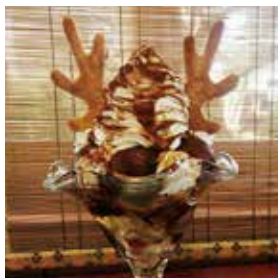
徳川四天王パフェ(本多忠勝) 910円(税込)