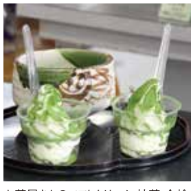
お茶屋さんのソフトクリーム 抹茶 金輪 (カップ362円/ミニカップ315円/コーン334円) ※各税別