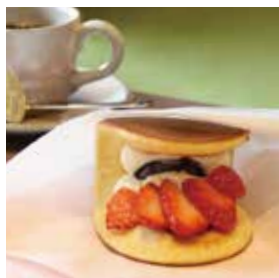
いちご小倉 Rond 350円(税込)