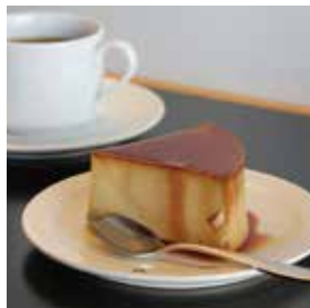
カスタードプリン 400円(税込)