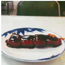
みたらし団子 85円(税込)