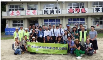
台湾からの視察団(R7年9月)

また、国内からは「自然共生サイト※」に認定されている鳥川を訪れ、同サイト認定を目指し学んでおられました。