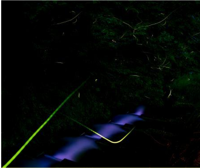
推薦 市長賞『光跡』秋屋 實