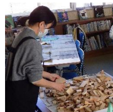
材料を整える講師

材料は間伐材の端材、木の枝や実などです。ボンドで自由に貼り付け、年齢を問わず楽しんでいました。