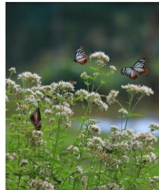
特選 教育長賞 『旅する蝶』高須 吉郎