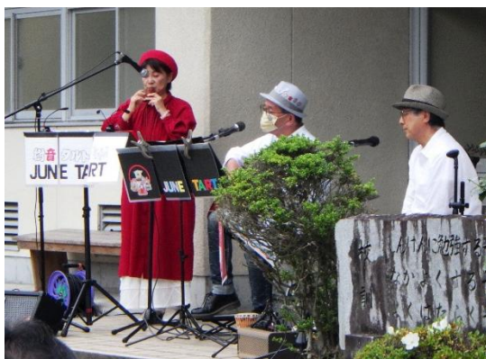
樹音タルトのみなさん