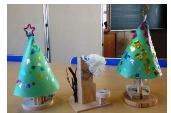
ツリー内に灯りをセット☆