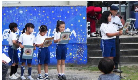
ホテルクイズ出題と回答の様子