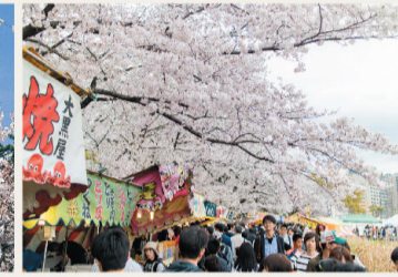
乙川河川敷には露店が並びます