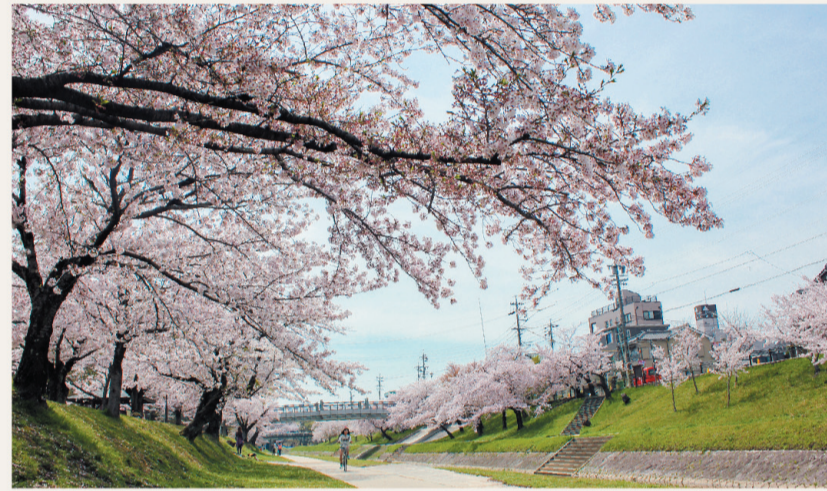
伊賀川沿いの遊歩道