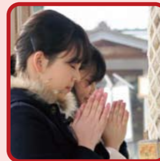
きちんとおまいり