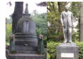
志賀重昂の墓と銅像