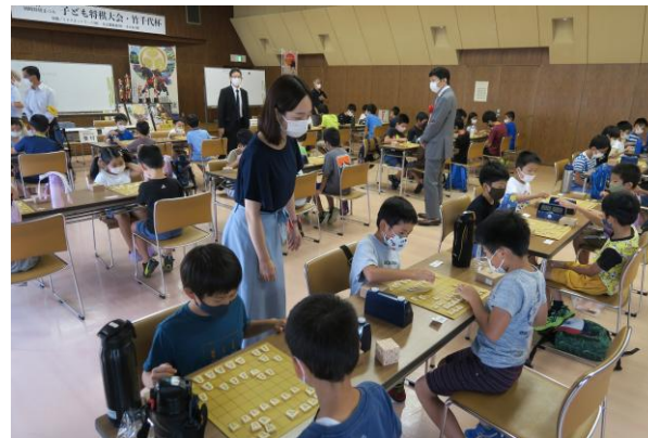
●第29回（2022年）子ども将棋大会