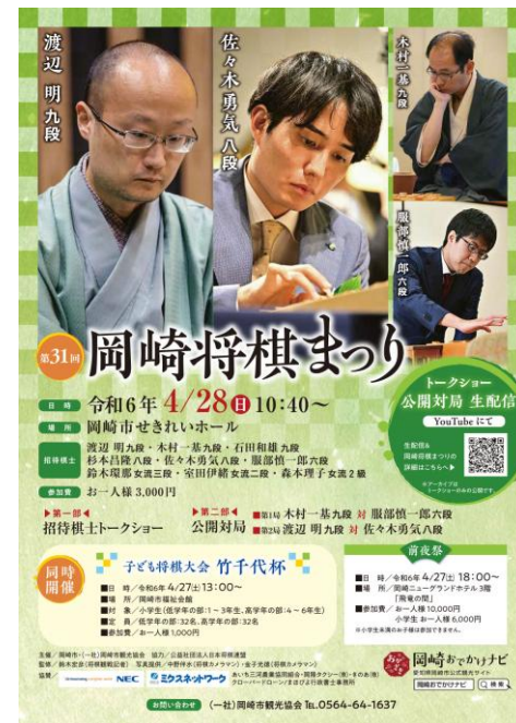
第31回 (2024年) 将棋まつりwebチラシ