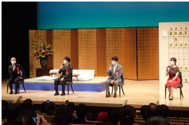
●第29回（2022年）トークショー