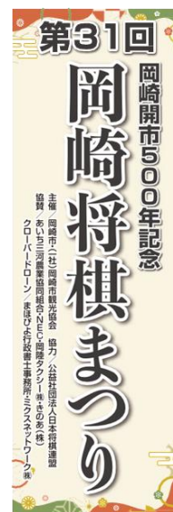
<参考> 第31回 (2024年) 将棋まつり入口看板