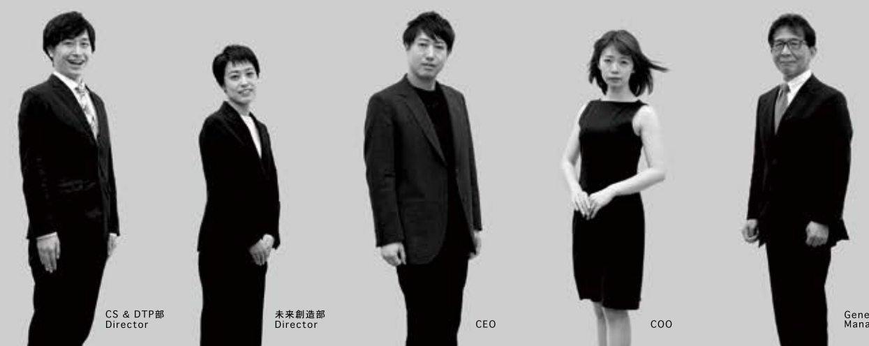
CS & DTP部 Director