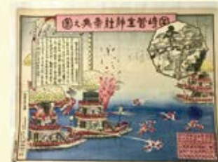
菅生まつり版画(大正時代)

菅生まつり鉾船(ホコブネ)神事奉納花火は戦後、岡崎市花火大会と共同開催となり現在に至ります。打ち上げ花火の他に菅生川(乙川)に浮かぶ2艘の船をご存じでしょうか。これらの船は「鉾船」と言い、菅生の大神様へ花火を奉納する船です。