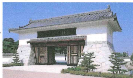
岡崎公園大手門前 <ガイド待機場所>