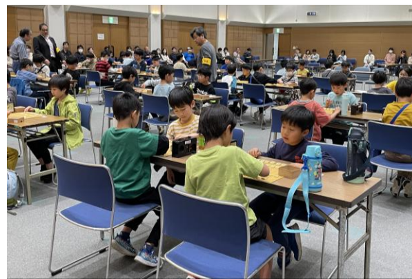
●第32回（2025年）子ども将棋大会