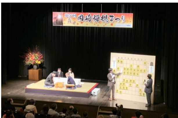
●第27回（2020年）公開対局 ※りぶらホール