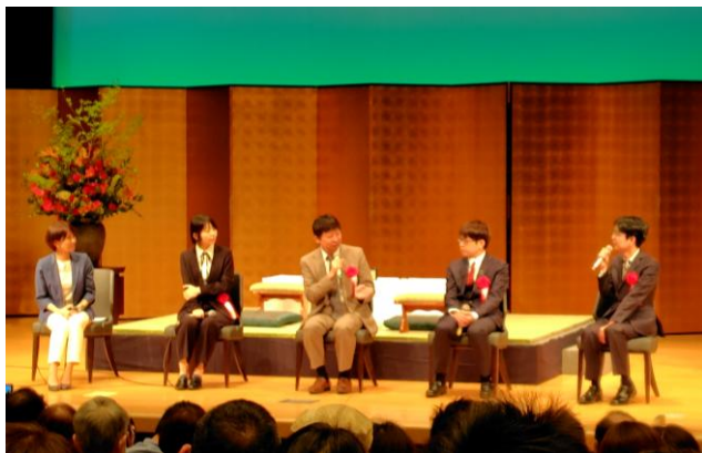
●第32回（2025年）トークショー ※せきれいホール