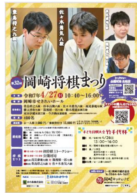
第32回 (2025年) 将棋まつりwebチラシ