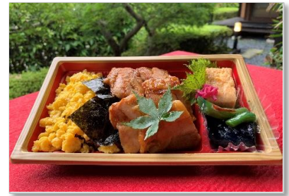
きじ焼き重 900円 (税抜価格) (972円税込価格)