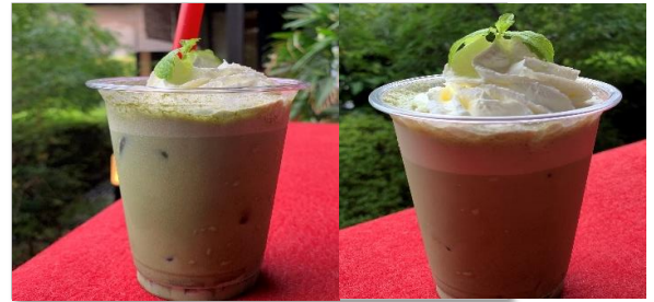
わらびもち小豆抹茶ラテ 黒糖きなこほうじ茶ラテ 780円 (税抜価格) (842円税込価格)