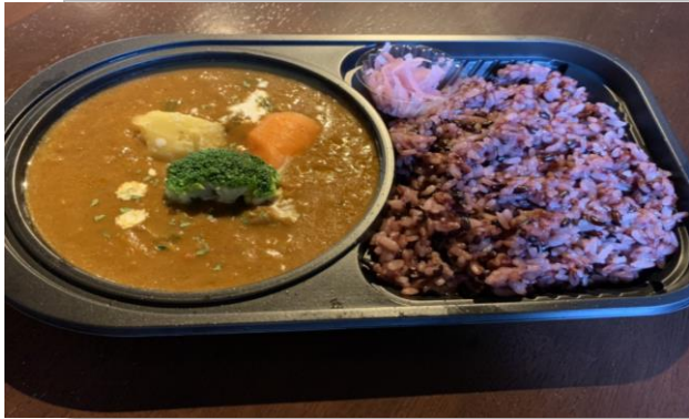
カレーライス 500円 (税抜価格) (540円税込価格)