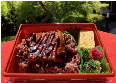
うなぎ重 1,350円 (税抜価格) (1,458円税込価格)