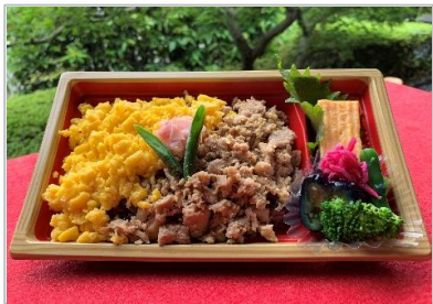
そぼろ弁当 800円 (税抜価格) (864円税込価格)