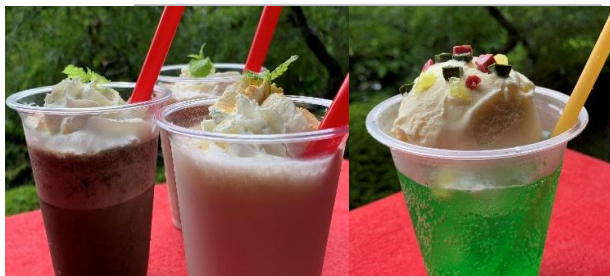
フラッペ 680円 (税抜価格) (734円税込価格) (バナナ・ほうじ茶・クリームソーダ)