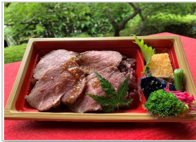
ローストビーフ重 900円 (税抜価格) (972円税込価格)