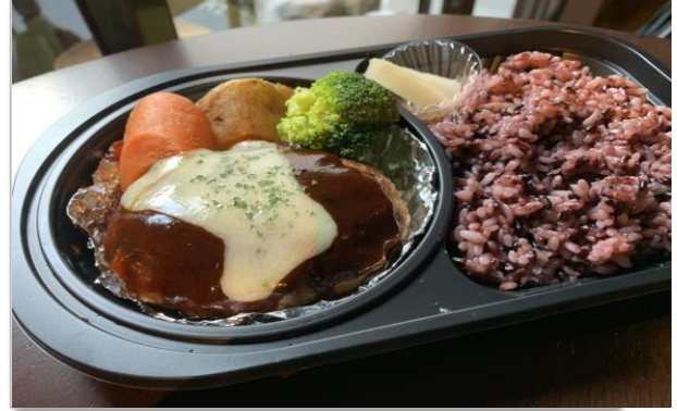
ハンバーグ弁当 600円 (税抜価格) (648円税込価格)