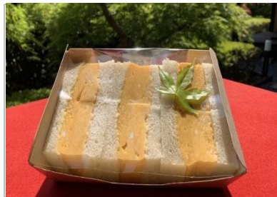
玉子サンド 780円 (税抜価格) (842円税込価格)