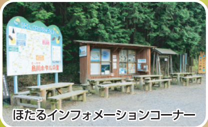
ほたるインフォメーションコーナー

川岸はホタルがサナギから成虫になったり、産卵したりする 大切な場所です。踏み荒らさないようにしましょう。